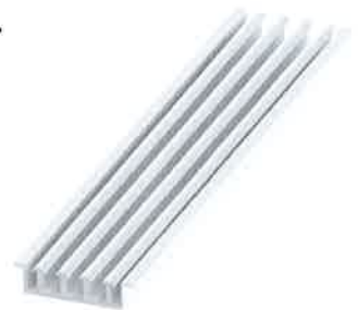
Unterrail mit Rinne